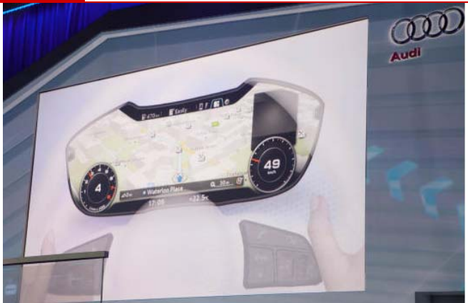
도표 2 아우디의 안드로이드 기반 스마트 디스플레이