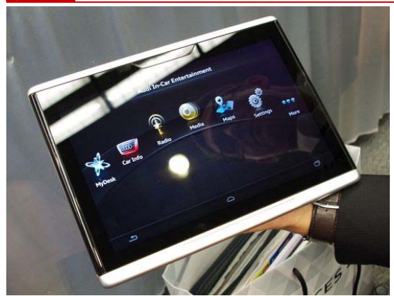
도표 3 아우디의 스마트카용 태블릿